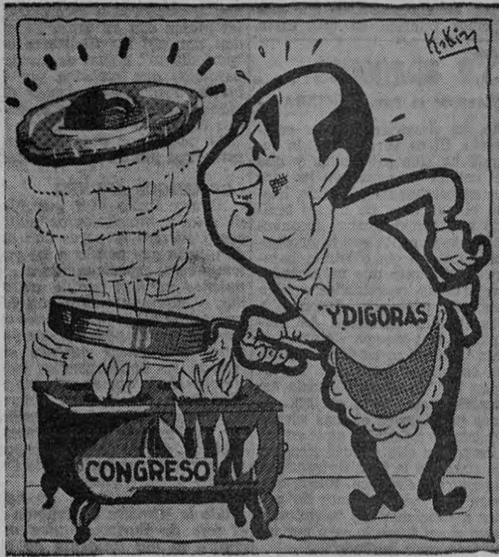
Si las "tortas" produjeron dinero... ya estaría millonario!

Malhumorado el inglés y sonriente el ruso, luego del encuentro.—