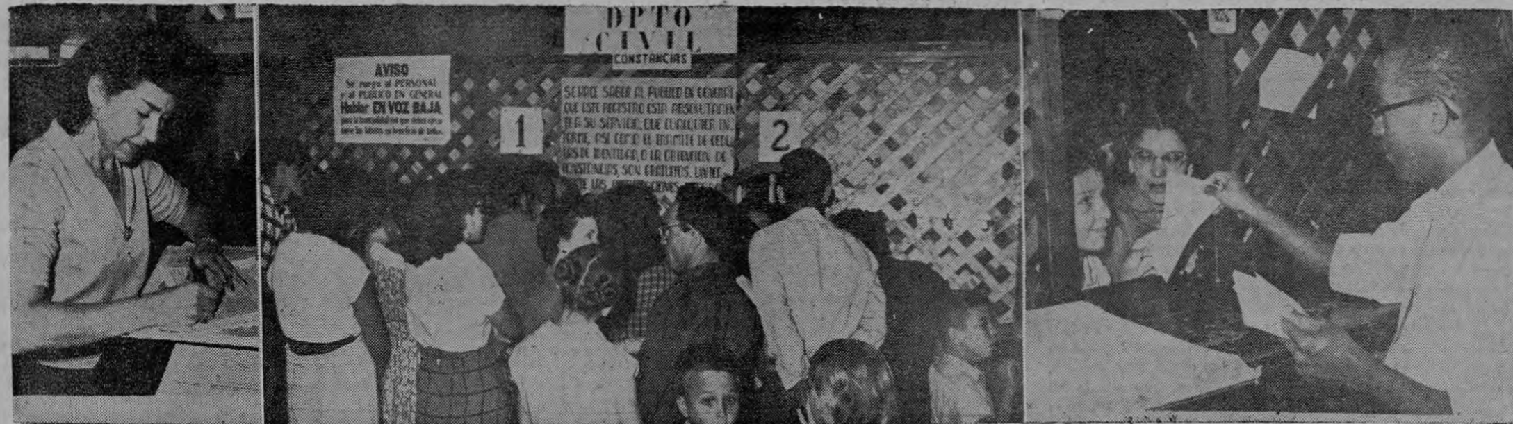
Colas de padres de familia y encargados sacando constancias de nacimiento.—2.700 ayer, y hoy más de 3 mil —